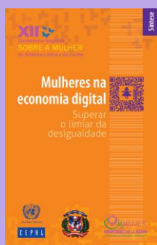
Mulheres na economia digital – Superar o limiar da desigualdade