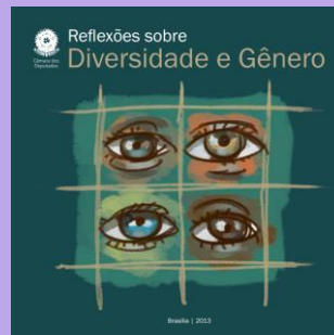
Reflexões sobre Diversidade e Gênero