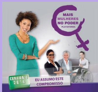
Plataforma “Mais Mulheres no Poder”