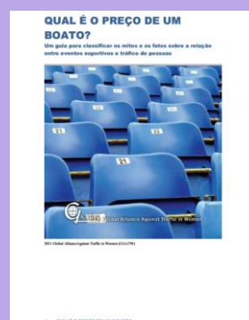
Qual é o preço de um boato? – Um guia para classificar os mitos e os fatos sobre a relação entre eventos esportivos e tráfico de pessoas